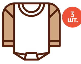
Боди с длинными рукавами