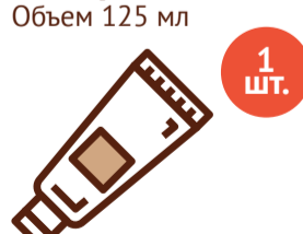
Крем от опрелостей Объем 125 мл