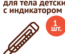
Термометр для тела детский с индикатором