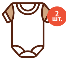
Боди с короткими рукавами