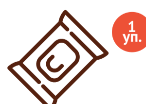
Влажные салфетки детские