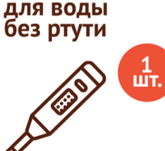
Термометр для воды без ртути