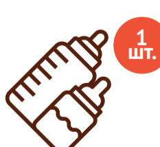
Бутылочка Объем 125-150 мл