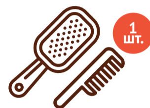
Набор «Расческа + щетка»