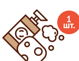
Гель для купания Объем 250 мл