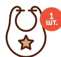
Слюнявчик с завязками